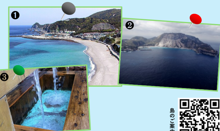
①前浜海水浴場 ②多幸湾(空撮) ③多幸湧水