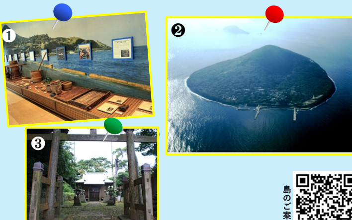
①利島村郷土資料館 ②利島(空撮) ③阿豆佐和気命神社