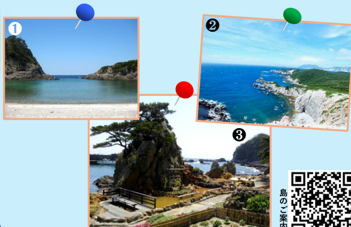
①泊海水浴場 ②神引展望台 ③松が下雅湯