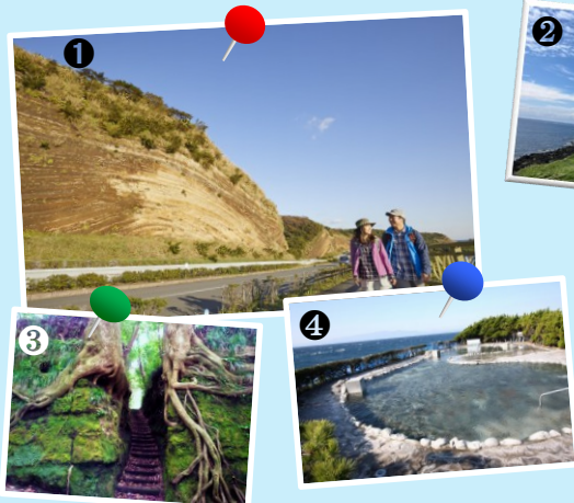
①地層大切断面 ②サンセットパームライン ③泉津の切通し ④浜の湯