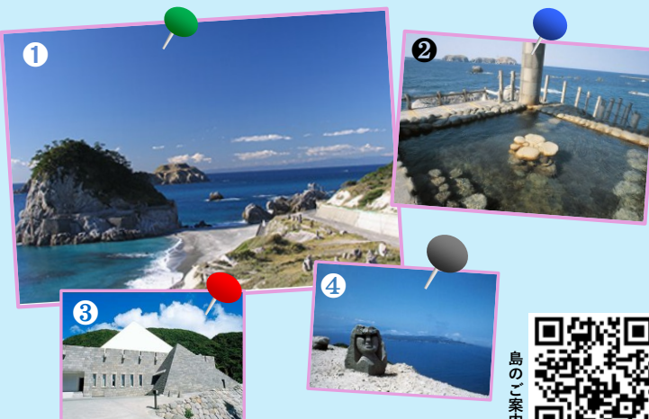
①南々下海岸 ②湯の浜露天温泉 ③新島村博物館 ④モヤイ像