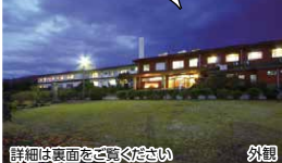
詳細は裏面をご覧ください