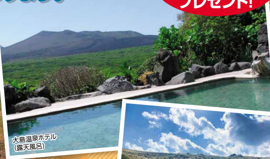
大島温泉ホテル (露天風呂)