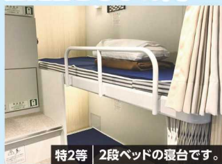
特2等 2段ベッドの寝台です。

おひとり様につき 1,000円増 で往路の船室を 1等にランクアップ することができます*子どもは500円 出発日の前日までに申し込みください 1等 ※他のお客様と男女相部屋になります。