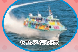
セブンアイランド友