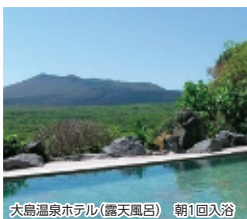
大島温泉ホテル(露天風呂) 朝1回入浴