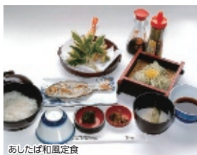
あしたば和風定食